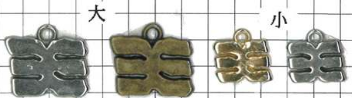
SD046片面 中華マークよこ