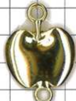
SD503両面 リンゴ(丸カン付)