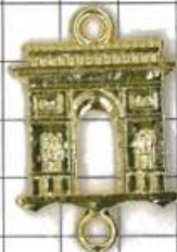
SD044片面 凱旋門(丸カン付)