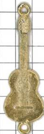
SD053片面 ギター(丸カン付)