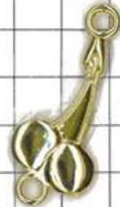
SD505両面 サクランボ(丸カン付)