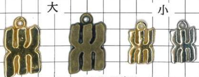
SD048片面 中華マークたて