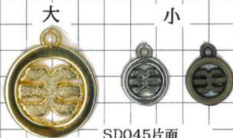
SD045片面 中華マーク丸よこ