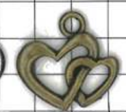
SD506両面 ダブルハート