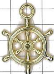
SD007両面 ダイヤなしダリン