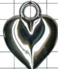
SD121片面 ハート 両面も有り