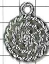
SD116両面 スカシうず巻