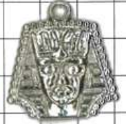
SD025片面 スフィンクス