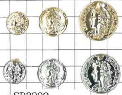
SD2000 エリザベス(プレス)