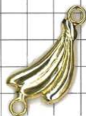
SD502両面 バナナ(丸カン付)