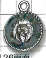
SD126両面 ライオン小ラメエボ入