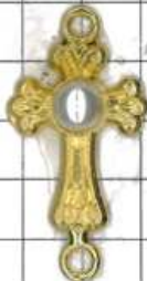
SD022片面 十字架(丸カン付)