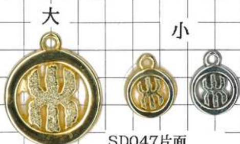
SD047片面 中華マーク丸たて