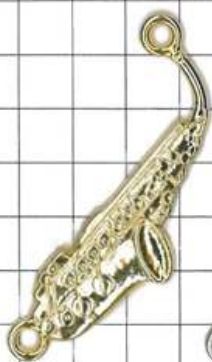
SD051片面 サクソホン(丸カン付)