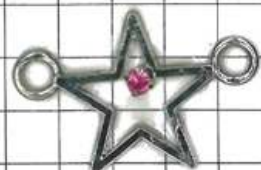
SD720両面:星 ダイヤ両リング