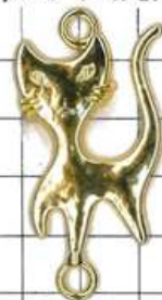
SD037片面 ネコ(丸カン付)