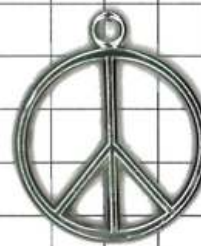
SD114両面 ピースマーク