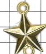
SD021片面 星ムク(丸カン付)