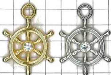
SD006両面 ダイヤ入ダリン