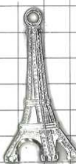
SD043両面 エッフェル塔