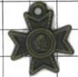
SD028片面 十字架コイン