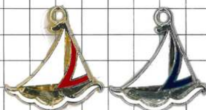
SD005片面 エボ入ヨット