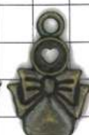
SD518両面 リボン付ピン